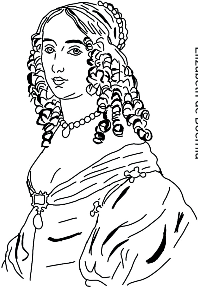
Elizabeth de Boêmia