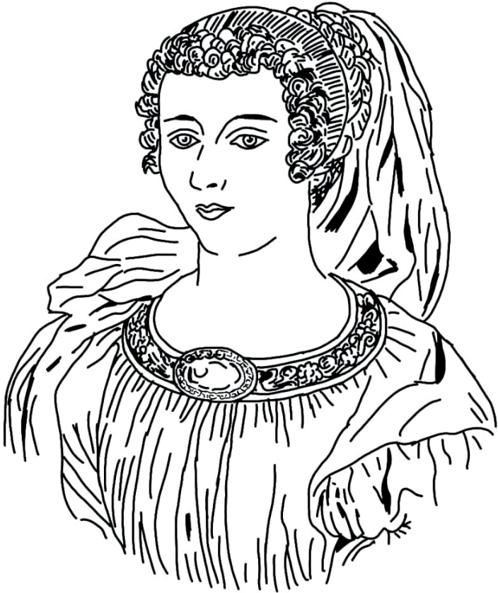
Marie de Gournay