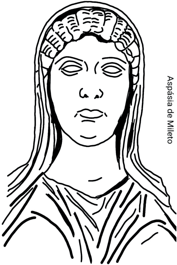
Aspásia de Mileto