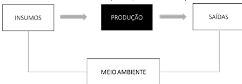
FIGURA 1 – Fluxo de produção contínua de produtos

Mais: no âmbito do processo produtivo é gerado, para além dos produtos, outros elementos, a exemplo de gases e resíduos com níveis de toxicidade diversos que retornam para o meio ambiente, muitas vezes degradando a terra, o ar, a água e causando/intensificando processos de adoecimento para a população humana. Quando se considera que os produtos (bens de consumo), dado o processo de obsolescência planejada, tendem a ser rapidamente descartados, observa-se que o processo de degradação ambiental continua, com o crescimento contínuo do lixo que também impacta negativamente a saúde ambiental e humana.