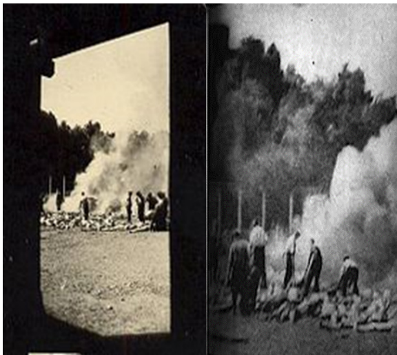
Anônimo [membro do Sonderkommando de Auschwitz], Cremação de corpos gaseados nas fossas de incineração ao ar livre, diante da câmara de gás do crematório V de Auschwitz, agosto de 1944. Oswiecim, Museu estatal de Auschwitz-Birkenau [negativo nº 277 e 278.]. (Anônimo, apud Didi-Huberman, 2020, p. 26-27).

Só assim com esse apagamento de imagens e palavras seria possível o desaparecimento total que incluía o desaparecimento da língua das vítimas e o desvio perverso da língua alemã. “[...] pense-se na inocência da expressão Shutztaffel , que se abrevia SS, e que denota a ‘proteção’, o ato de abrigar [...] (Didi- Huberman, 2020 p. 36). Hannah Arendt, citada por Didi-Huberman falava dos campos de concentração em 1950, como “laboratórios de uma experiência humana de dominação total” (p. 35).