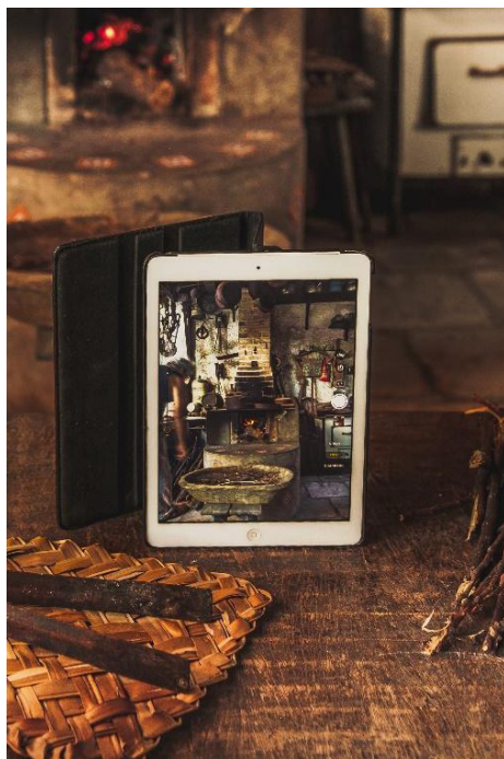
Museu Vivo do Nordeste.

atualidades que celebra a capacidade de invenção e de criação do humano.