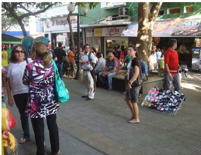
Figura 3 - Territórios de confrontos e de distintos personagens

Constatamos que há um crescente comércio e ocupação do Calçadão , o que tem gerado conflitos dos ambulantes entre si e destes com a Prefeitura Municipal de Campina Grande (PMCG). Observa-se que, além da diversidade de mercadorias vendidas, há também a acentuação de um conflito remetido à possibilidade deste espaço está sendo explorado economicamente por pessoas não residentes em Campina Grande, mas em municípios próximos. Reeditando assim mais um indicador da potencialidade deste território (vide Figura 3), enquanto resistência à cidade hegemônica.