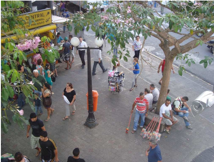
Figura 2 - A multiplicidade de usos do Calçadão

“(...) infelizmente o Calçadão hoje não é mais visto como antes, uma praça de bate papo, de descontração (...)” (Proprietário de lanchonete, informação verbal).