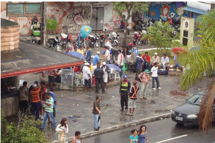
Figura 8 - A ocupação do antigo cinema Capitólio, pelos ambulantes do Calçadão

O local escolhido , ou melhor, mais apropriado na opinião deles foi o Capitólio, que é um prédio histórico de Campina onde funcionou um antigo cinema. (Vide Figura 8).