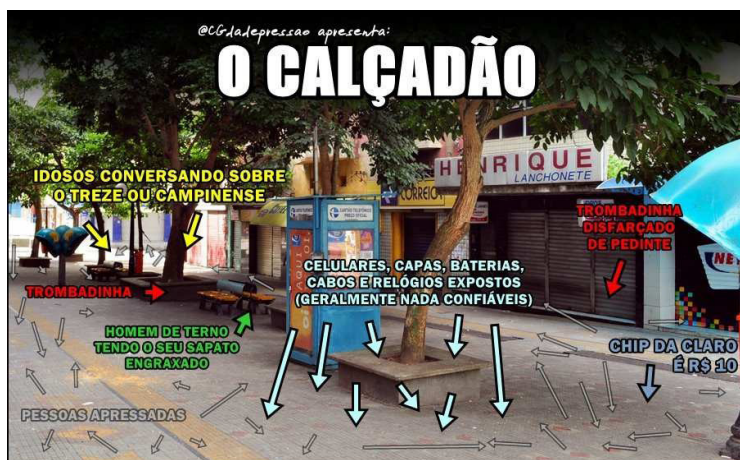
Figura 4 - Demarcações do Calçadão

Uma pista que nos ajuda a esclarecer essa pergunta é dada pela Figura 4. Nela, vemos a demarcação e representação feita pelos Campinenses sobre o Calçadão, e publicada em uma famosa rede social.