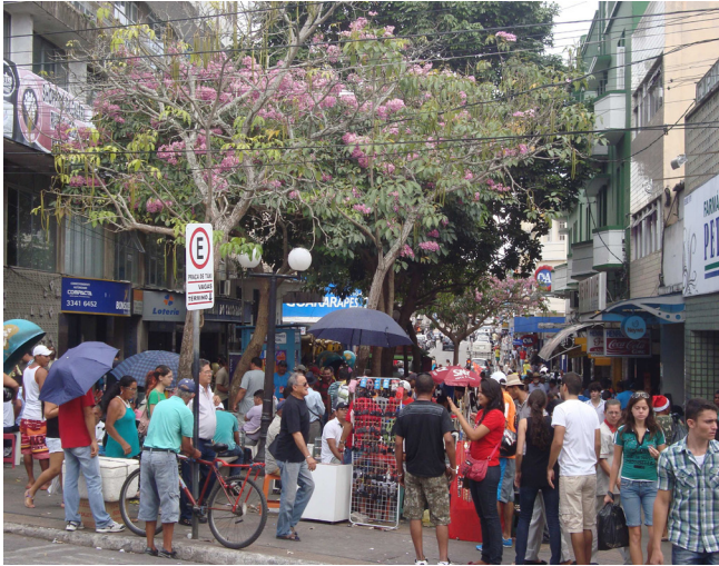
Figura 1- As estratégias de localização

tenho visão (...) (vendedora de loteria, informação verbal).