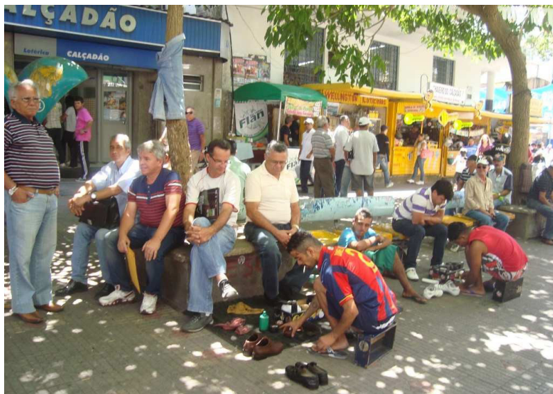
Figura 10 - Engraxates que resistiram à expulsão

As observações feitas em campo também nos mostraram que apesar de toda essa fiscalização e confronto realizado com os ambulantes, estes conseguem burlar (Vide Figura 10) o oficialmente estabelecido, seja através do retorno ao local proibido em outros horários que não fiscalizados, seja pela própria resistência e manifestação.