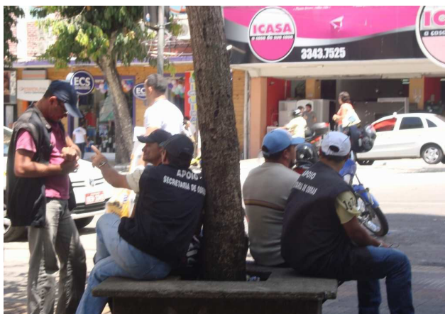
Figura 6 - Fiscais da Secretaria de Obras da PMCG