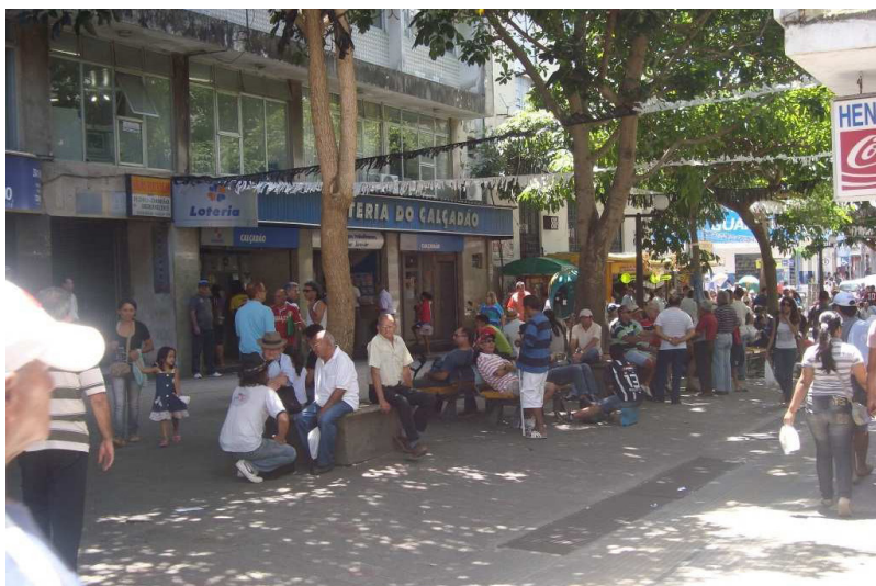
Figura 7 - O Calçadão em meio à ausência dos ambulantes

As imagens acima (Figuras 5 e 6) foram registradas dois (02) dias após o cumprimento da execução de uma ação judicial, a qual teve por finalidade a retirada de todos os ambulantes do Calçadão . Esta ação contou com a participação de policiais militares e agentes de fiscalização da Prefeitura Municipal de Campina Grande- PMCG, estes últimos ainda permanecem no local para assegurar que os ambulantes não retornem. Todas essas mudanças ocorridas neste espaço afetaram de forma significativa o cotidiano do Calçadão e de seus frequentadores. O que nos chamou muito a atenção foi perceber que com essas mudanças aumentaram o número de idosos que o frequentam e utilizam sob novas brechas (vide Figura 7).