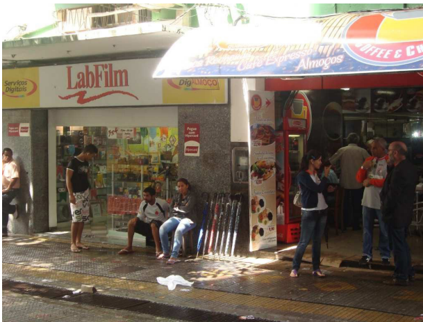
Figura 9 - As resistências no Calçadão

Porém como todo movimento está inscrito em uma dialética, os ambulantes não iriam ficar imóveis diante dessa situação, utilizam-se, pois dos contrausos (Vide Figura 9, logo abaixo) e resistências urbanas.